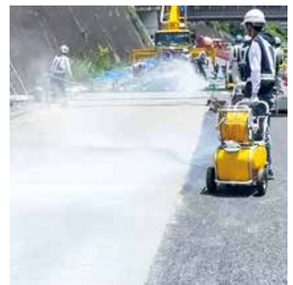
▲機械式噴霧器による散布—視認性良好