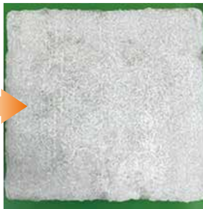
▲モルタルへ散布後外観—透明被膜を形成し自然な風合い