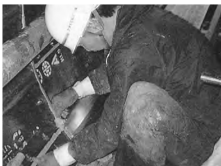
▲シールド工場の1次止水にボンドトップWAを使用