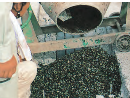
▲透水性水路にEB-42PSグレー(樹脂のみ)を使用