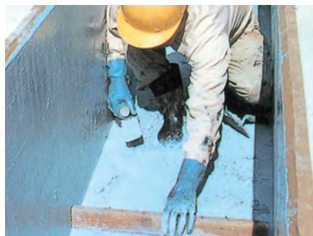
▲水路橋の保護モルタルとしてEB-42を使用