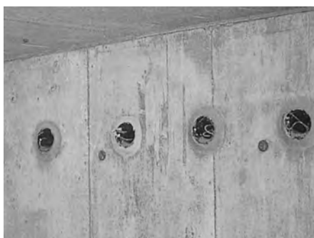
▲ベルマウス取付け部にボンドトップWGを使用