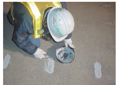
▲ホーンジョイントの跡埋め材として、 コールミックスグレーを使用