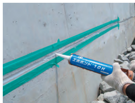
▲ひび割れへエポボンド1CHを使用