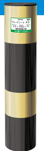
ウィードシートAS 8m/本