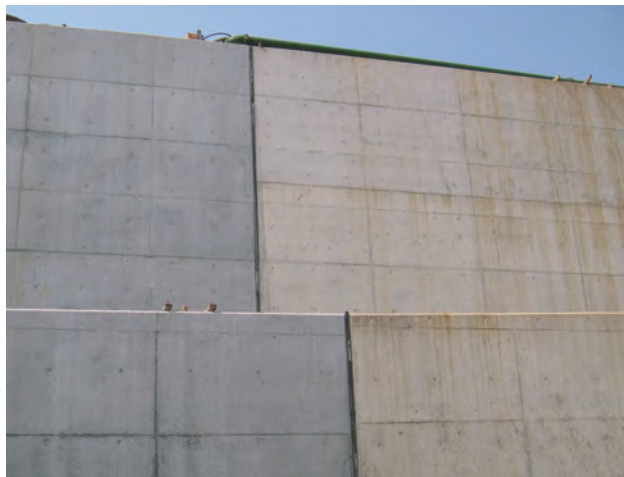
▲地下構造物の目地に使用