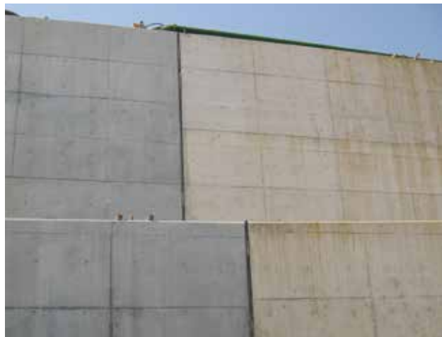
▲地下構造物の目地に使用