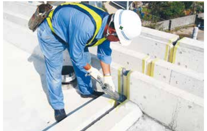
▲新幹線高架橋の接合目地にAOIシリコンシーラント02LNを充填