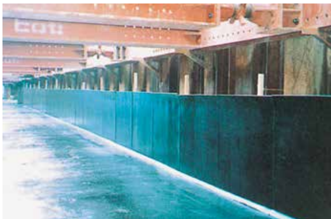
▲地下構造物に使用

※AOIエラストイトは、厳重な品質管理と独特な原料配合で機械的に大量生産されたアスファルトマスチック板です。高い品質と生産力によって全国の需要をまかない、広い販売網をもっています。