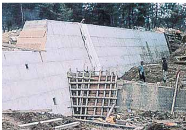
▲砂防堰堤のコンクリート打設に使用