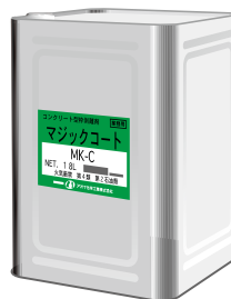
マジックコートMK-C 18ℓ/缶