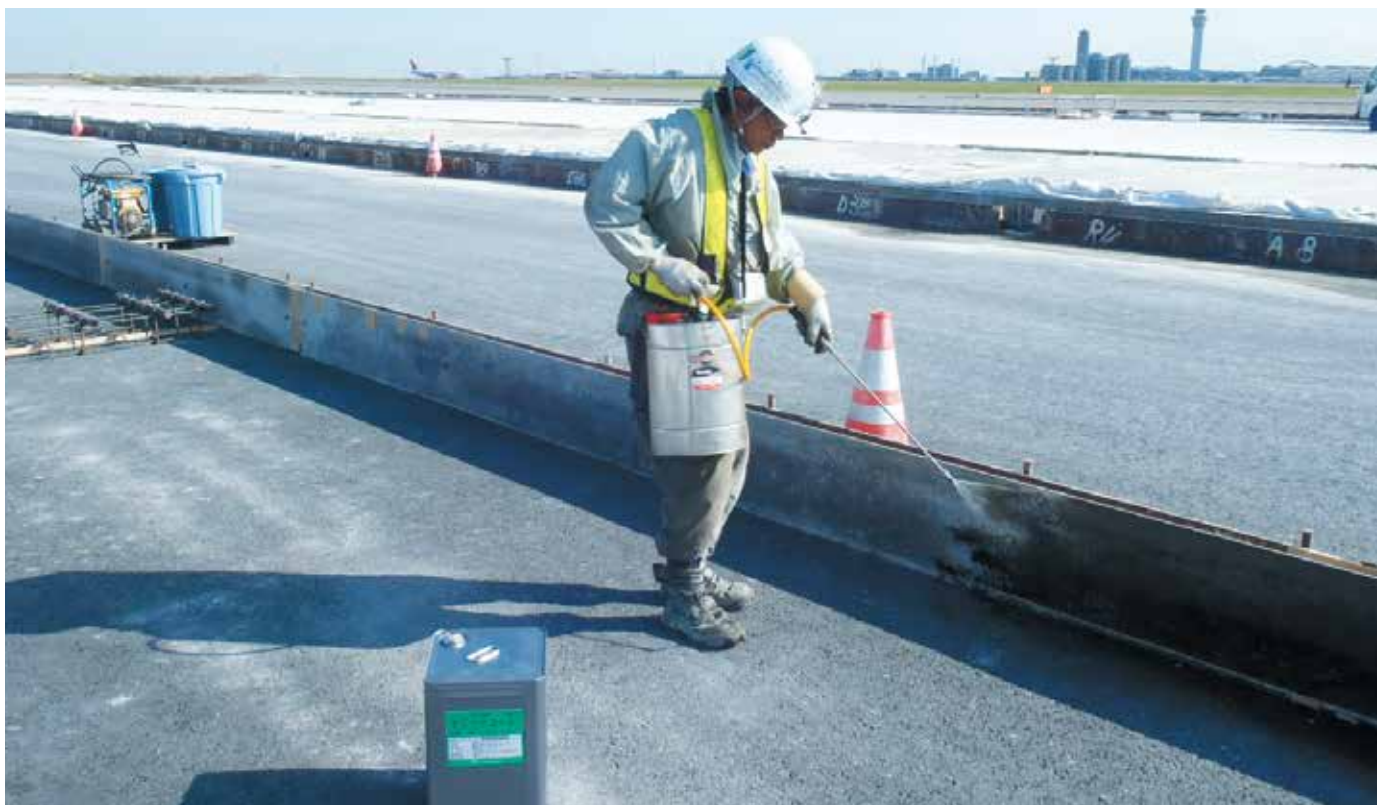
▲コンクリート舗装の型枠へのマジックコート塗布状況

コンクリート工事用型枠、コンクリート二次製品の成形用等の金属製、プラスチック製、木製の種々の型枠に塗布することにより気泡や油泡の発生が少ない良好な仕上がりと剥離効果が得られ、優れた剥離剤として広く使用いただき多くの実績を得ております。