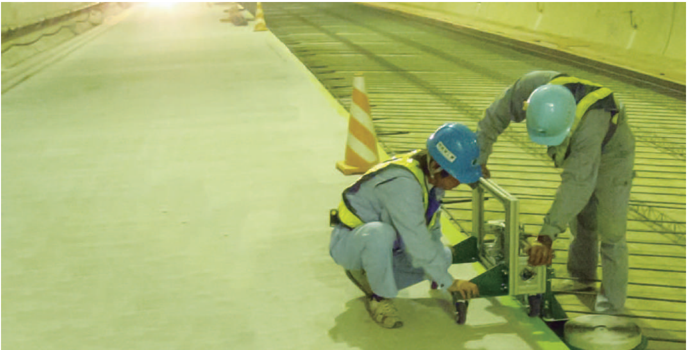
▲キッシーラー1401(専用機械使用)貼り付け状況

キッシーラー1401は、柔軟性および粘着性を有する自着性コンパウンドです。キッシーラー1401中の活性基と生コンクリート中の金属酸化物とが反応して、生コンクリートの硬化と共にコンクリートと接着し止水効果を発揮する止水材です。