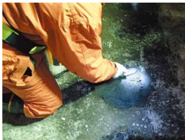
▲アスファルト舗装のポットホール補修状況