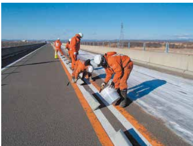
▲チャッターバーの固定状況