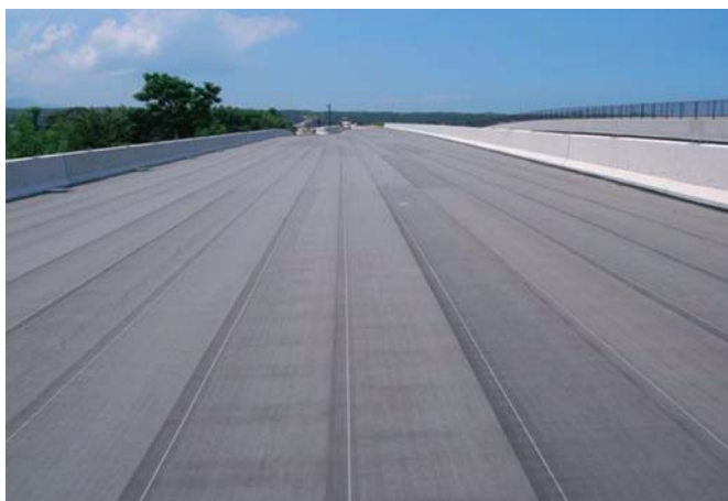
▲コールドルーフ貼り付け完了の状況

※1:(社)日本道路協会床版防水便覧 規格(基本照査試験)/NEXCO3社 グレードI・規格B