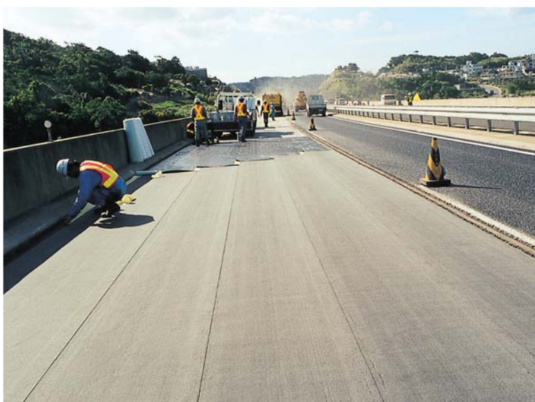
▲コールドルーフ設置の状況

シート設置時の転圧接着での密着。 アスファルト合材敷設時の加熱転圧で膨張した水蒸気が除去されます。