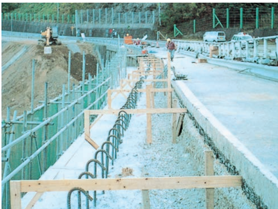
▲コンクリートのかさ上げ