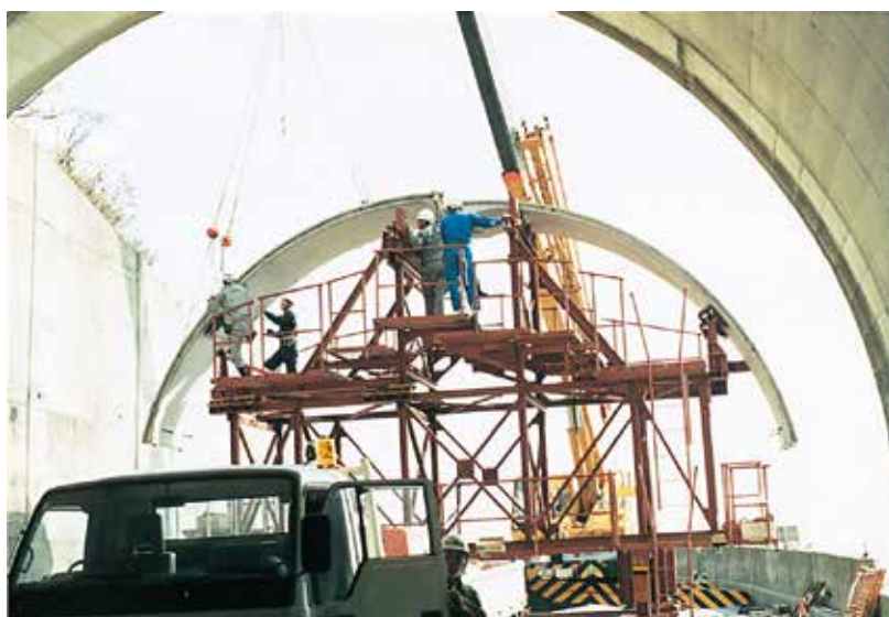
▲トンネルPCL工法にボンドパットを使用