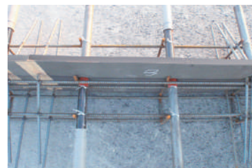
▲舗装膨張目地に使用