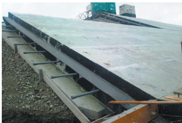
▲防潮堤の目地に使用