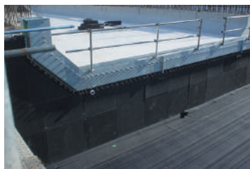
▲空港構造物の緩衝材に使用