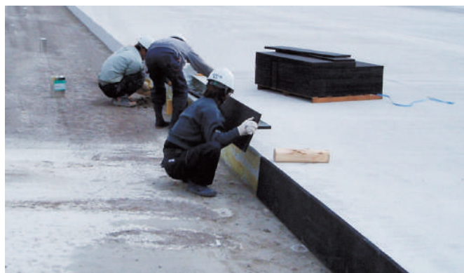
▲空港舗装の目地に使用