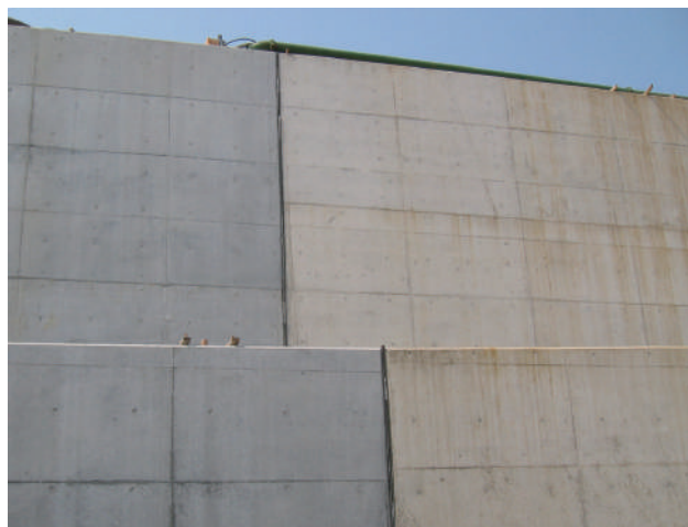
▲地下構造物の目地に使用