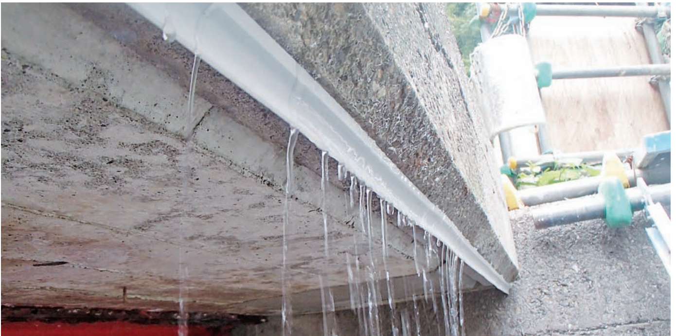
▲構造物底にウォーターカッター設置状況