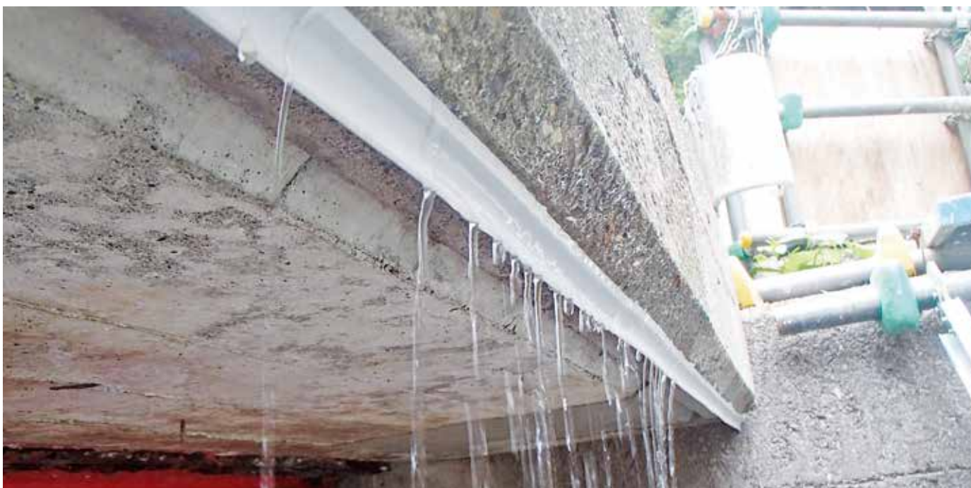
▲構造物底にウォーターカッター設置状況